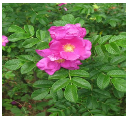
北見市の花(ハマナス)

期 日 平成27年11月28日（土）、29（日） 会 場 道立北見体育センター 主 管 網走地区サッカー協会 北見サッカー協会 網走地区フットサル連盟