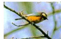
函館市の鳥 ヤマガラ

主催：(公財)北海道サッカー協会・北海道自治体職員サッカー連盟 主管：函館地区サッカー協会 期日：平成28年6月4日(土)～7日(火) 会場：(Eコート) 函館フットボールパーク 天然芝サッカーグラウンド (C・Dコート) 函館フットボールパーク 人工芝多目的グラウンド (A・Bコート) 東大沼多目的グラウンド (トルナーレ)