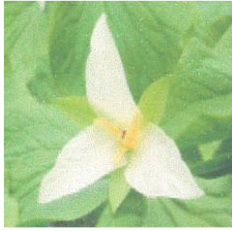
名寄市の花 エンレイソウ